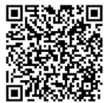
觀光管理系 07-381-4526 #17233